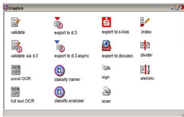
Fig. 3: I singoli moduli di d.capture batch

Qualora nella catena di processo si verificasse un errore - ad esempio la lettura inesatta di un codice a barre con conseguente